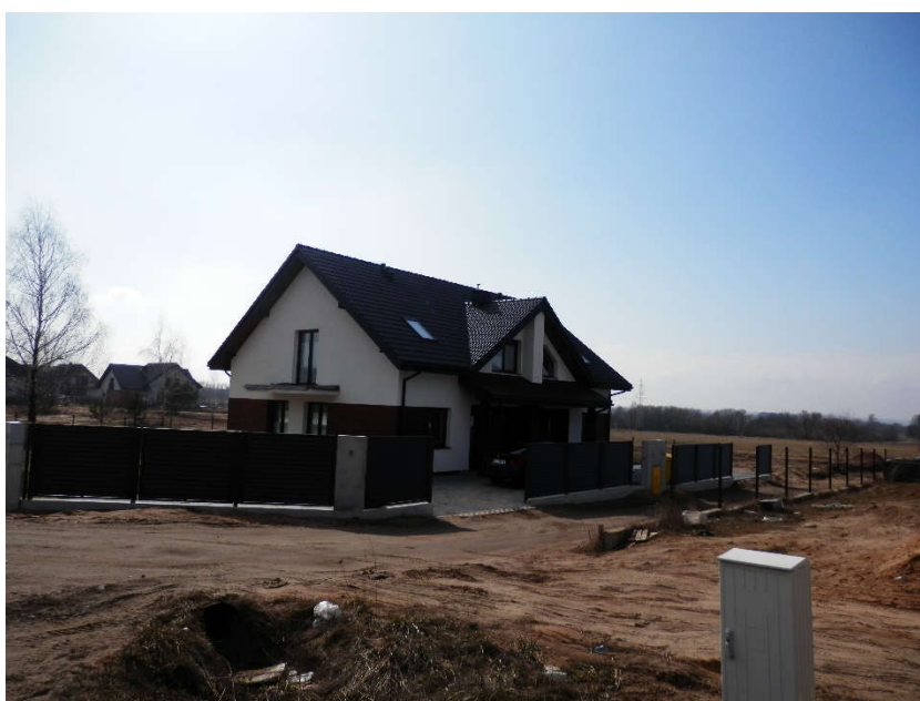
Ryc. 5, 6. Zabudowa w bliskim sąsiedztwie obszaru opracowania