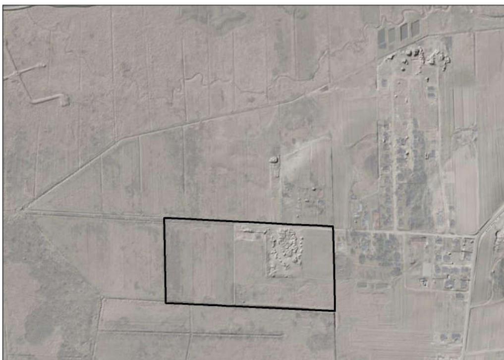
Ryc. 2. Rzeźba terenu na obszarze opracowania