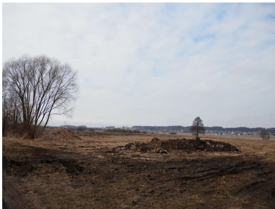
Ryc. 3, 4. Przykłady zieleni urządzonej na obszarze opracowania i jego bezpośrednim sąsiedztwie